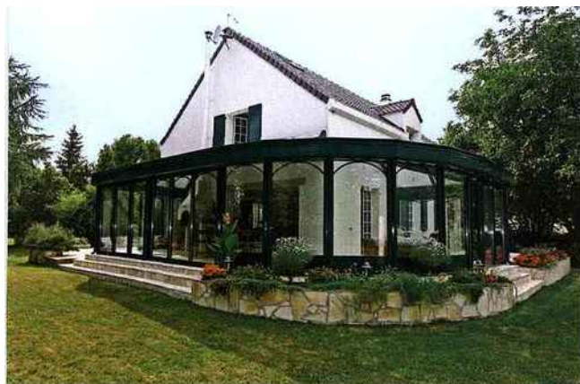
Ci-dessous à gauche : les nombreuses qualités de l'aluminium en font un matériau très répandu dans la construction de verandas. Il vous offre un espace agréable dans une luminosité ambiante et dispose d'une vaste palette de couleurs et d'aspects, du métallisé à l'imitation bois, en passant par les sablés, les mouchetés... (Scintelle). Ci-dessous à droite : la recherche esthétique conçue pour bénéficier d'un maximum de lumière et un très beau volume geré comme un prolongement naturel de la maison (Veranco).

leurs, matières et volonté esthétique sans compromis se rejoignent alors pour créer un monde à part conçu pour vous, pour que votre projet soit unique, afin que verandas et bassins – quand ils ne sont pas judicieusement intégrés à l'intérieur – trouvent leur meilleure place dans l'harmonie végétale et minérale de votre jardin.