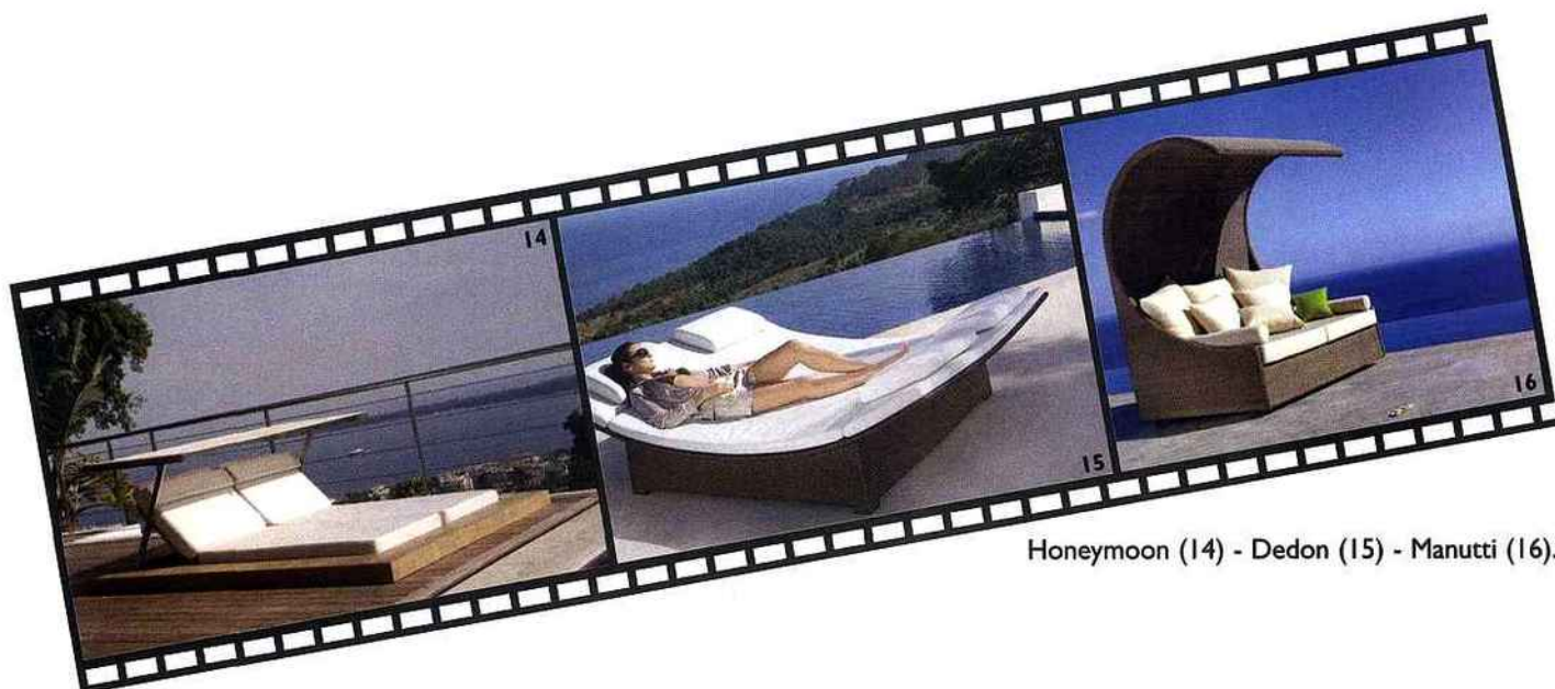
Honeymoon (14) - Dedon (15) - Manutti (16).